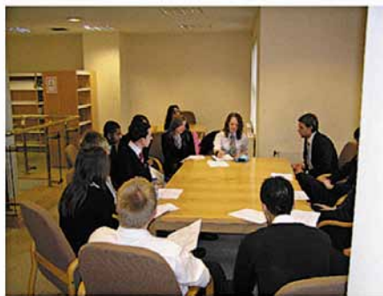
Рада учнівського самоврядування загальноосвітньої школи міста Волверхемптон, Великобританія

Дисципліна залишається основною пересторогою школи і викладачів, які не бачать, куди їх може завести демократія. Вони побоюються, що учнів, коли їм нададуть право голосу, неможливо буде закликати до дисципліни: учні не будуть згодні з вказівками; вони будуть позбавляти авторитету школу – і все закінчиться хаосом.