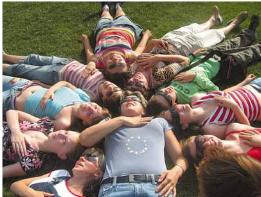
Теперішні учні – запорука існування стійкої демократії в Україні.

Два приклади з Португалії, що підтверджують повагу різноманітності: