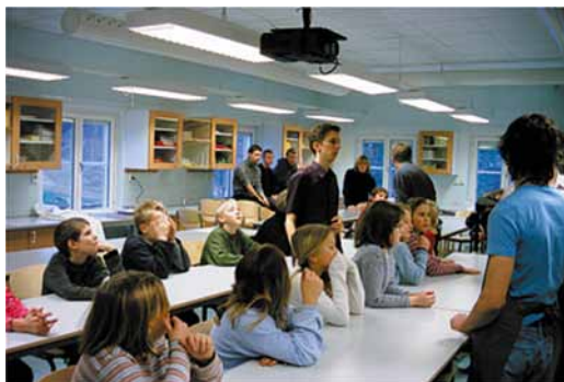
Старшокласники навчають молодших учнів у гімназії Толлінге, Швеція

У початковій школі ім. Пилипа Пилиповича в Белграді, Сербія, була розроблена стратегія щодо залучення всіх учасників до розвитку цієї школи. У 2004 р. почав здійснюватися проект під назвою “Планування прогресу в школі”, яким керувала група з розвитку школи, що складалася з директора, вчителя і двох зовнішніх консультантів.