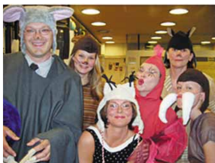
Разом граємо у виставах, загальноосвітня школа Ройхувуори, м. Хельсінкі, Фінляндія

За основними предметами успішність учнів вийшла на ті ж рівні, як і в інших школах, проте в учнів набагато кращі навички соціального спілкування, і вони позитивніше ставляться до школи, ніж це спостерігається зазвичай. Вони поводяться терпиміше в конфліктних ситуаціях, а також проявляють більше ініціативи у своїй роботі в школі.