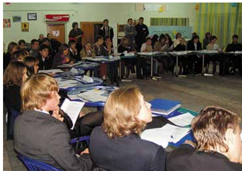
Рада учнівського самоврядування Київського ліцею бізнесу, Україна

Цілком природньо, що школи виділяють й інші важливі або навіть дуже важливі для них аспекти. Ці ж чотири сфери діяльності були обрані тому, що вони є загально визнаними. Те, як здійснюється врядування у школі, керівництво, повсякденна робота і підзвітність, неминуче є ключовим показником того, наскільки ця школа є демократичною ( ключова сфера 1 ). Також, якщо ми виходимо з того, що освіта заснована (або повинна бути заснована) на цінностях, то ці певні цінності мають йти глибоким корінням саме в цінності демократії, тобто в ключову сферу 2 .