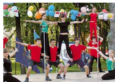
Пізнаємо світ разом! Заняття в гуртках, на семінарах, репетиціях перетворюються на захоплюючі вистави, презентації, змагання для всієї громади. Київський ліцей бізнесу, Україна