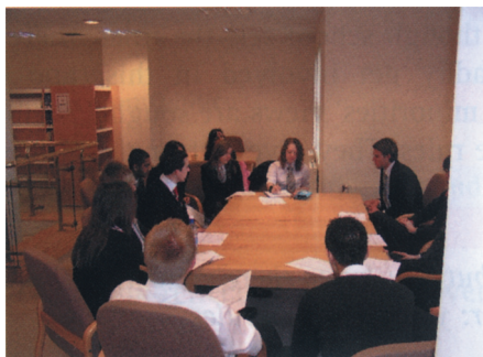
Совет учащихся в общеобразовательной классической школе в Волверхэмптоне

Дисциплина остается основным предметом опасения у школ и преподавателей, которые не видят, куда их может завести демократия. Они опасаются, что учащихся, когда им предоставят право голоса, невозможно будет призвать к дисциплине: учащиеся будут спорить с любыми указаниями; они будут подрывать авторитет школы — и все закончится хаосом.