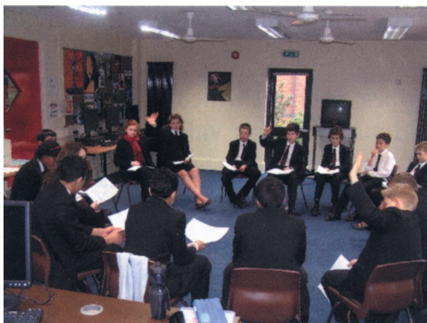
Совет учащихся средней школы Ворверхемптона, город Ворверхемптон, Соединенное Королевство

Совершенно естественно, что школы выделяют и другие области, которые столь же важны или даже более важны для них: эти же четыре области деятельности были выбраны потому, что они являются примерами, получившими широкое освещение. То, как осуществляется правление в школе, ру-