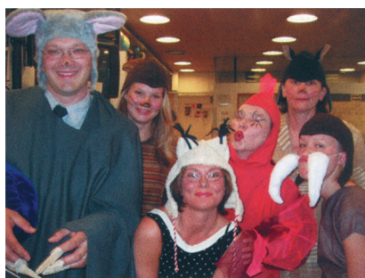
«Играем вместе» в начальной школе Ройхувуори, Хельсинки, Финляндия.

По ключевым предметам успеваемость учащихся вышла на такие же уровни, как и в других школах, однако, у учащихся намного лучше навыки социального общения, и они более положительно относятся к школе, чем это наблюдается обычно. Они, как представляется, ведут себя более терпимо в конфликтных ситуациях, а также проявляют больше инициативы в своей работе в школе.