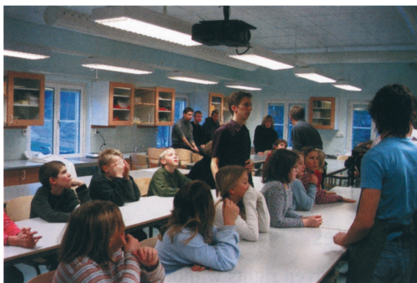
Учащиеся старших классов обучают учеников младших классов в гимназии Толлинге, Швеция

В начальной школе имени Филиппа Филипповича в Белграде, Сербия, была разработана стратегия по вовлечению всех участников в развитие этой школы. в 2004 году начал осуществляться проект под названием «Планирование прогресса в школе», которым руководила группа по развитию школы, состоящая из директора, учителя и двух внешних консультантов.