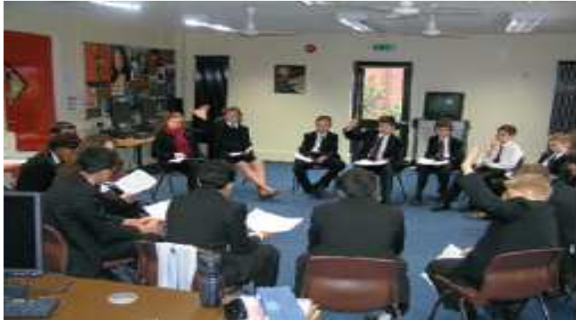
Këshilli i klasës në Gjimnazin klasik në Wolverhampton, Mbretëri e Bashkuar

Shkollat natyrisht se mund të gjejnë fusha të tjera të rëndësishme së njëjtë ose më të madhe se këto: këto katër fusha janë zgjedhur sepse janë shembuj që japin një trajtim mjaft të gjerë. Mënyra e zgjedhur se si qeveriset, udhëhiqet, mban vetveten dhe se sa konsiderohet përgjegjëse për shkollën, është pashmangshëm tregues kyç për atë se në çfarë mase funksionimi i saj është demokratik. Në mënyrë të ngjashme, nëse pranojmë se edukimi është (ose duhet të jetë) i drejtuar në vlera, atëherë vlerat e tilla duhet rrënjësuar thellë në vlerat e demokracisë, nëse shkolla promovon sinjerisht EQD-në: prej këtu rrjedh Fusha e rëndësishme 2.