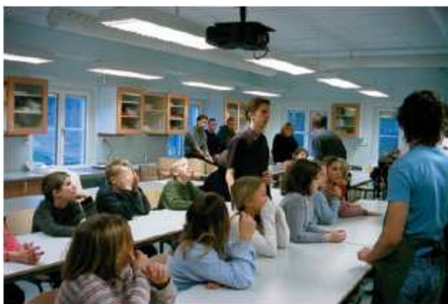
Nxënësit më të vjetër duke mësuar nxënësit e rinj në gjimnazin Tullinge, Suedi.

Shkolla fillore Filip Filipoviç në Beograd, Serbi, ka zhvilluar një strategji për përfshirjen e të gjitha palëve të interesuara në zhvillimin e shkollës. Në vitin 2004, ata filluan një projekt me emrin “Planifikimi i përparimit të shkollës”, të udhëhequr nga një ekip i zhvillimit të shkollës të përbërë nga drejtori, një mësues dhe dy konsulent të jashtëm.