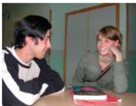
Nxënësit në gjimnazin Tullinge, Suedi

Dy shembuj nga Portugalia për çmuarjen e diversitetit: