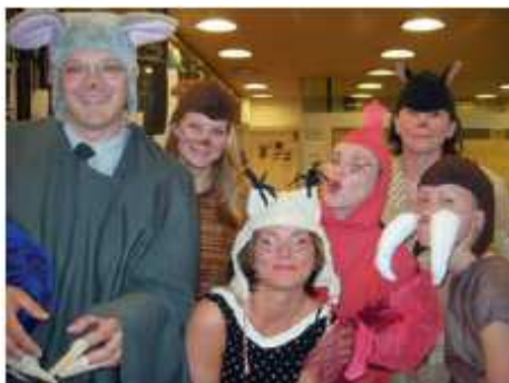
Duke aktruar së bashku në shkollën Fillore në Roihuvuori, Helsinki, Finlandë.

Në lëndët thelbësore, performansat e nxënësve kanë arrit nivele të njëjta si në shkollat tjera, por ata kishin shkathhtësi të shprehura shoqërore dhe mjaftë qëndrime pozitive ndaj shkollës në krahasim me mesataren e përgjithshme. Dukej se ishin më tolerant në situata konfliktuoze dhe tregonin më tepër iniciativë në punën e tyre në shkollë.