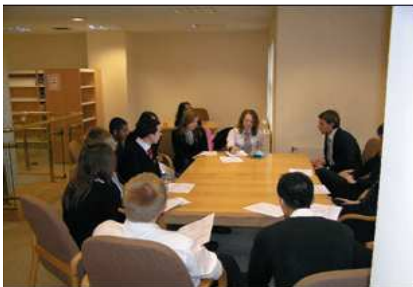
Këshilli i nxënësve në Gjinnazin klasik në Woverhampton